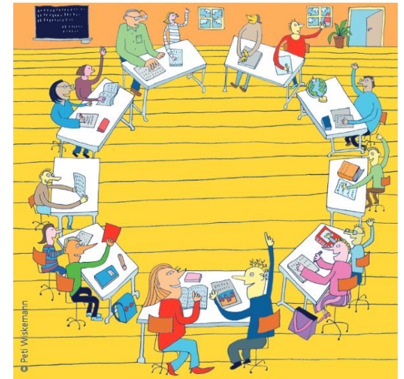
Karta Edukacji Obywatelskiej i Edukacji o Prawach Człowieka Rady Europy

Istotnym elementem edukacji obywatelskiej i edukacji o prawach człowieka jest promowanie spójności społecznej i dialogu międzykulturowego, docenianie różnorodności i uznanie równości, w tym równouprawnienia płci. Dlatego kluczowe jest rozwijanie wiedzy oraz umiejętności interpersonalnych i społecznych, które ograniczają konflikty, sprzyjają poszanowaniu i zrozumieniu różnic występujących między poszczególnymi grupami etnicznymi i wyznaniowymi, budują wzajemne poszanowanie godności człowieka i wspólnych wartości, zachęcają do dialogu oraz promują pokojowe rozwiązywanie problemów i sporów.